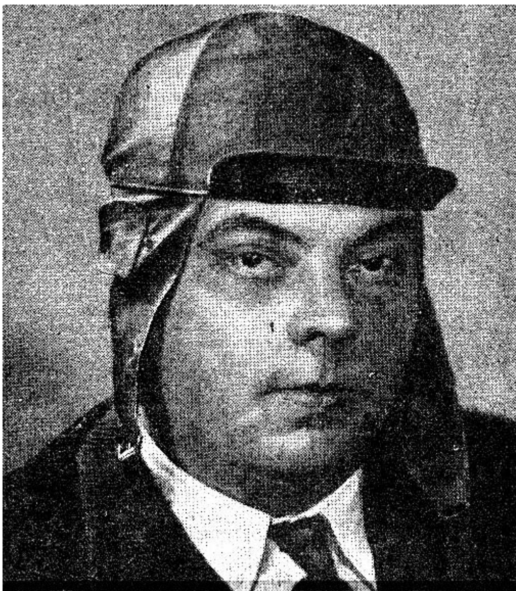
Antoine de Saint-Exupéry