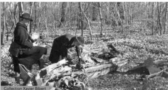
Collection Xavier Bibert