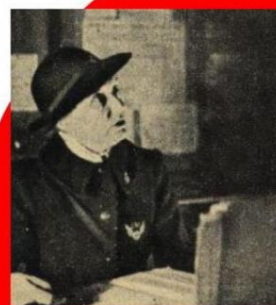
Recherche des aviateurs, 1942 7 jours site gallica BNF © Tous droits réservés

Sa mission s'achève en 1948 après sa 814e enquête. De retour à Tournon en 1952, elle écrit plusieurs ouvrages et articles parus dans la presse aéronautique. Elle rédige également des ouvrages sur l'Histoire de France et sur sa ville natale. Veuve, elle se remarie en 1966. Elle décède en 1986.