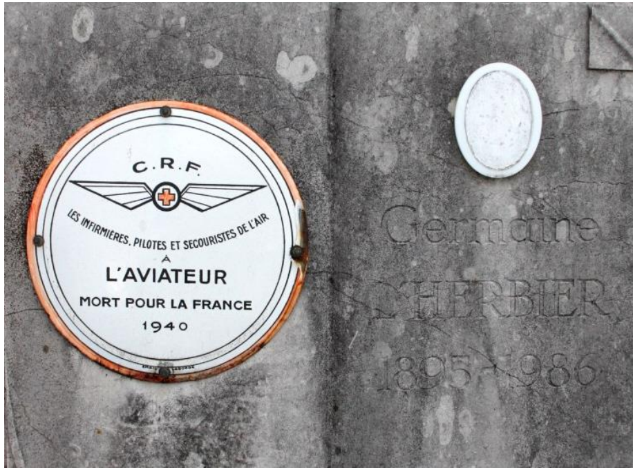
Tombe de Germaine L'Herbier Montagnon Cimetière de Tournon-sur-Rhône. 1895 – 1986