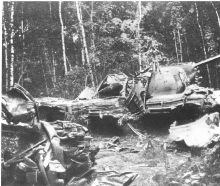
Un Potez 63 du GAO 547 abattu à Monthermé en Ardennes le 14 mai 1940