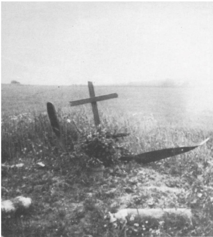
Saint Germainmont (Ardennes) L. Durand Sergent chef Resconssis Sergent Brun GAO Groupe II/55, Potez 63 abattu le 19 mai 1940

rions sur 41 appareils français et 68 avions anglais abattus. Nous avons été particulièrement désolés par la découverte, dans un bois sauvage, du cadavre d'un lieutenant qui, la cuisse brisée, était encore adossé à un arbre. Une main de son squelette tenait un carnet de route sur lequel il avait noté pendant six jours son agonie sans secours. L'autre main tenait une photo d'enfants.