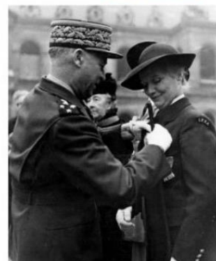
Le maréchal Juin lui remet la légion d'honneur, 1946.