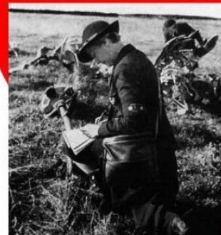
Recherche des aviateurs. Site Bibert © Tous droits réservés