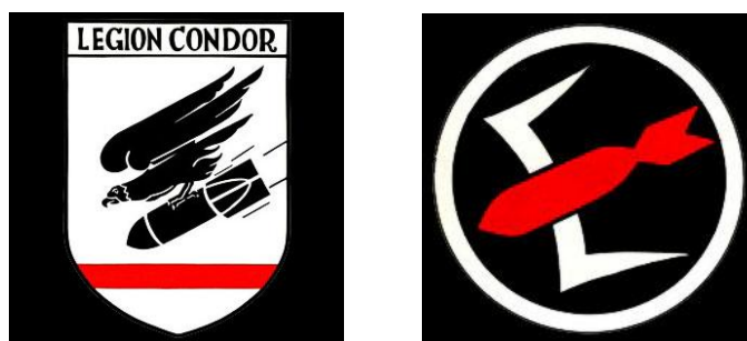
Insignes : Kampfgeschwader 53 « Legion Condor » et 3 ème Groupe (III./KG 53)

III./KG 53 (juillet-août 42) ( Bombardement - Heinkel 111 - Walter Brautkuhl )