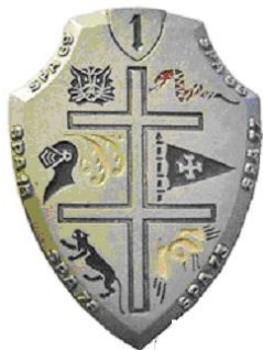
1 ère Escadre de Chasse