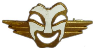
GC III/6 – 6 ème Escadrille