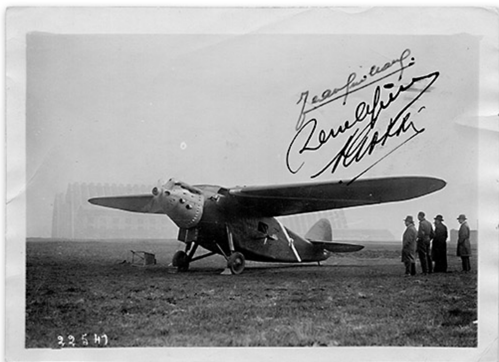
Bernard 191 GR « Oiseau Canari »