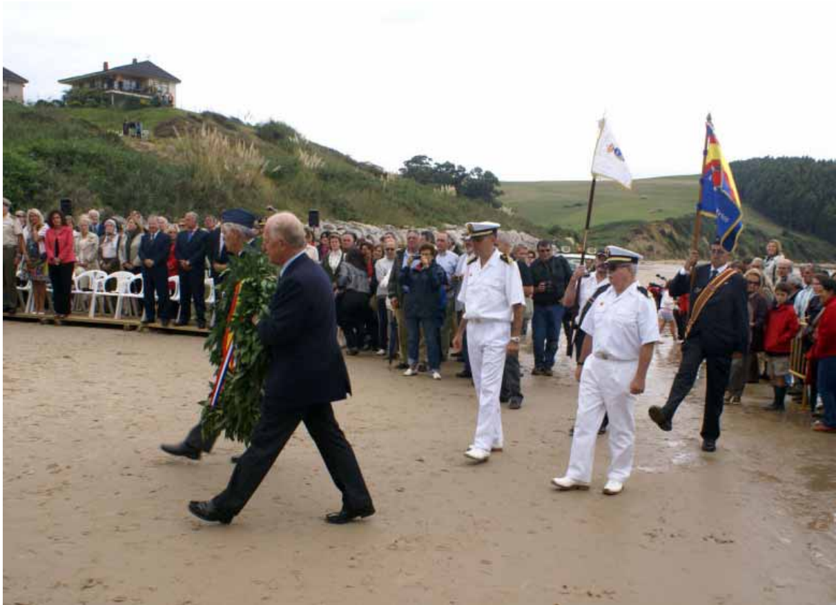
L'arrivée de la gerbe portées par les Vétérans français et espagnol au son de "l'hymne à la Joie" de Beethoven