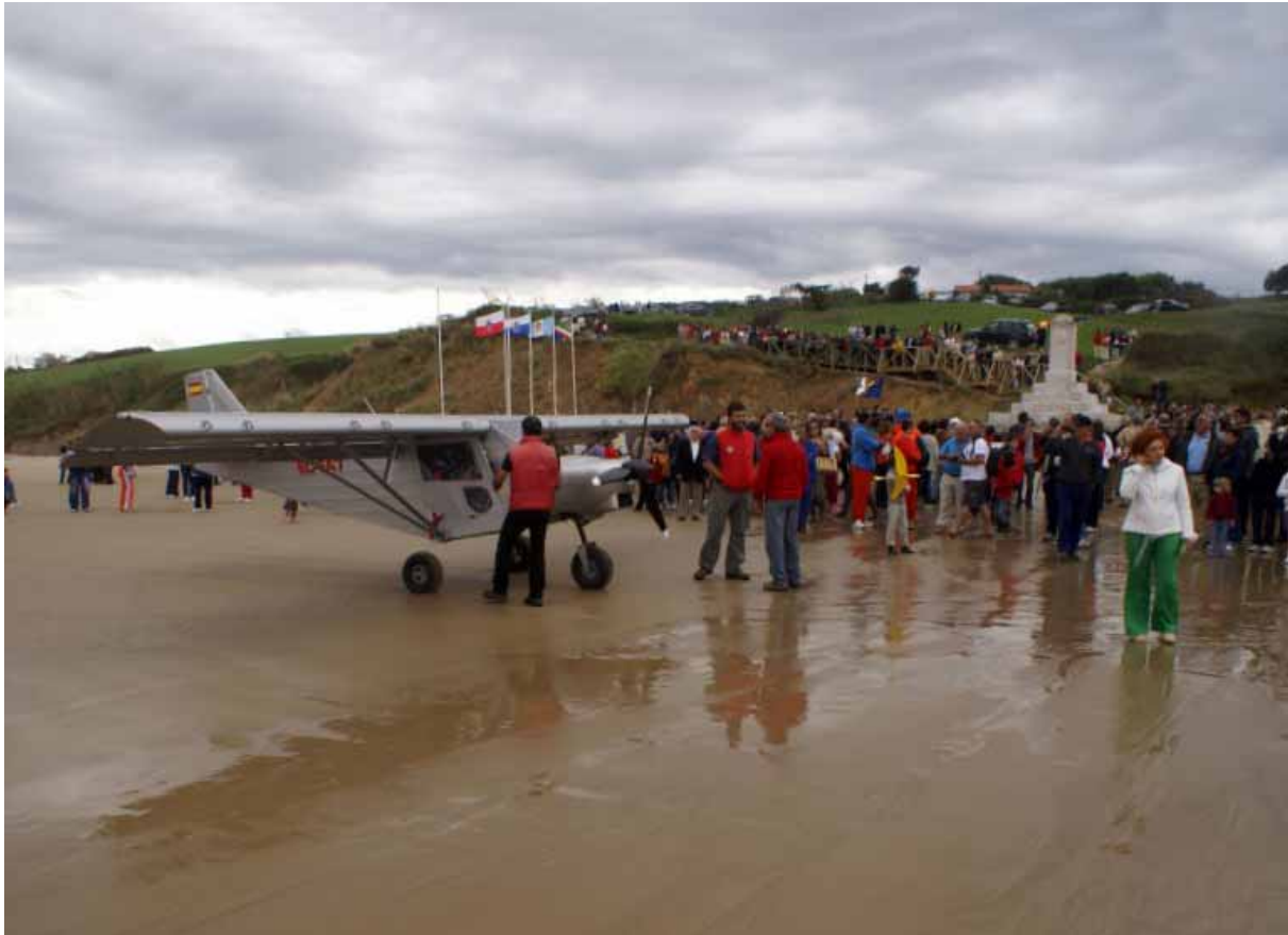
L'atterrissage du ICP MXP-740 Savannah du "Real Aero Club de Santander " devant le monolithe