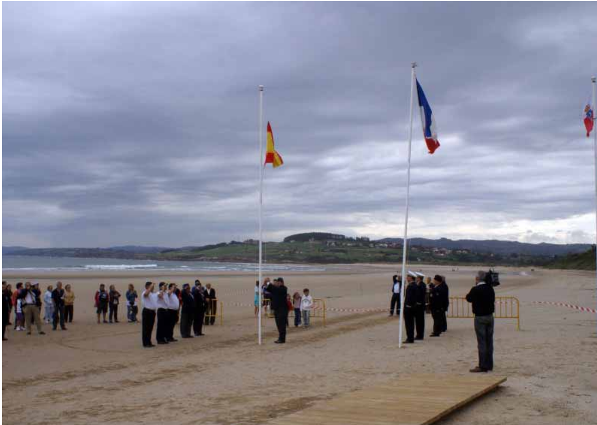
Les Hymnes nationaux français et espagnol