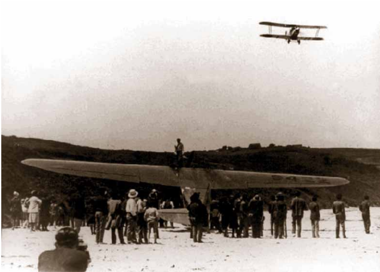
L'Oiseau Canari sur la plage de Oyambre et l'arrivée de l'avion ravitailleur Breguet espagnol piloté par I gesias et Jimenez le 15 juin 1929.