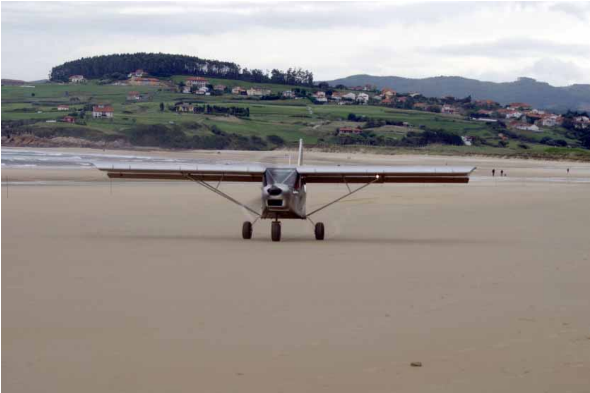
Atterrissage du ICP MXP-740 Savannah du "Real Aero Club de Santander" sur la plage de Oyambre.