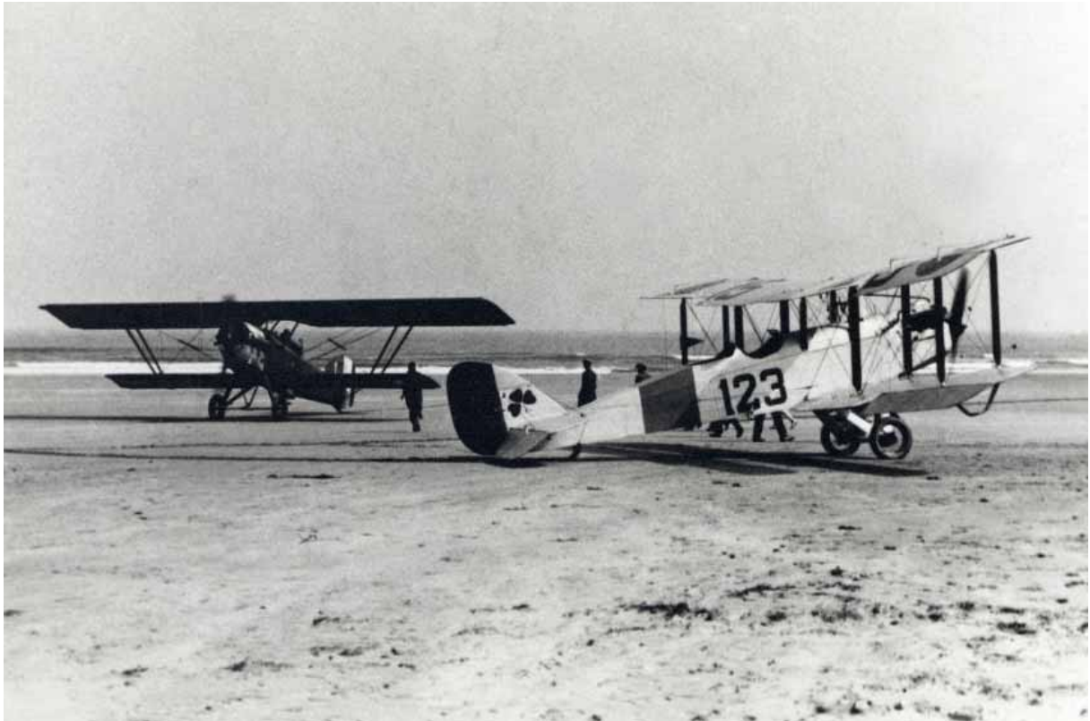
Avions français de la base de Tours et espagnol de Santander Plage de Oyambre le 8 septembre 1929