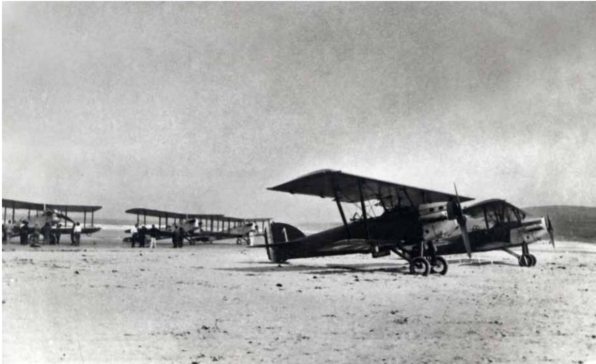
Avions français de la base de Tours et espagnol de Santander Plage de Oyambre le 8 septembre 1929