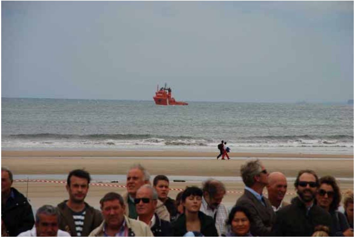
Le Coast Guard espagnol devant Oyambre