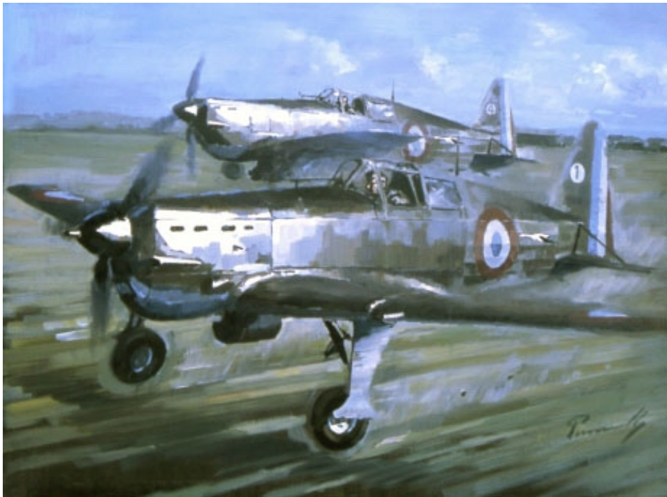
Huile sur toile de Lucio Perinotto