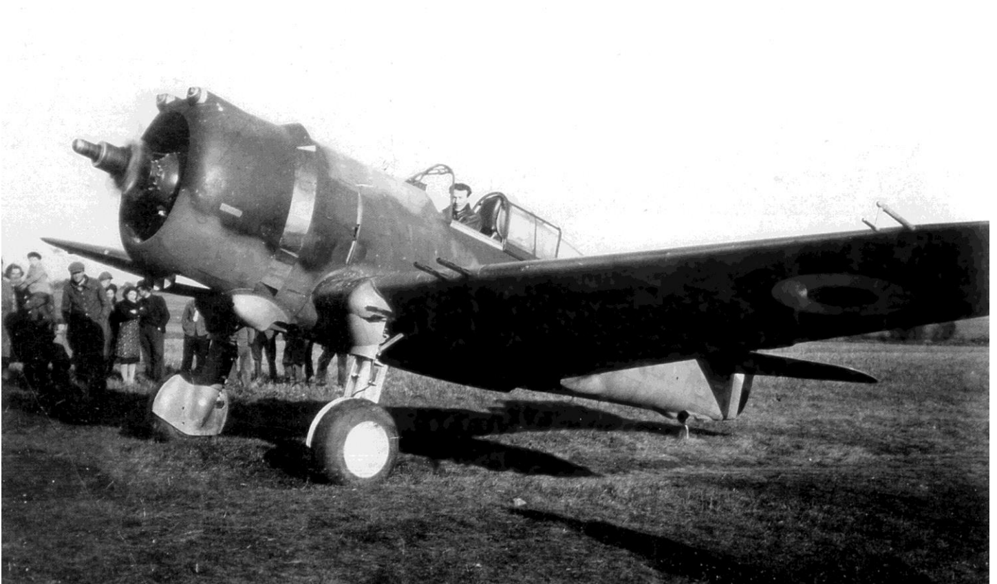
21 NOVEMBRE 1939 – LANGRES – LE CURTISS H-75 N°166 DU LIEUTENANT HOUZÉ POSÉ EN CAMPAGNE, TOUCHÉ PAR DES MESSERSCHMITT 109

Ci-dessous, deux photographies de la collection de Lionel Persyn