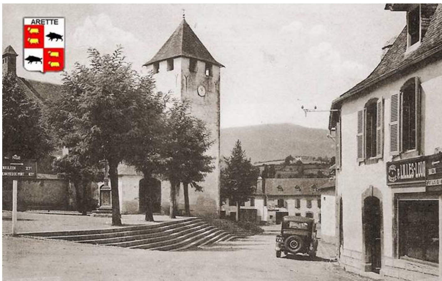
Arette (Pyrénées atlantiques) – Vers 1935