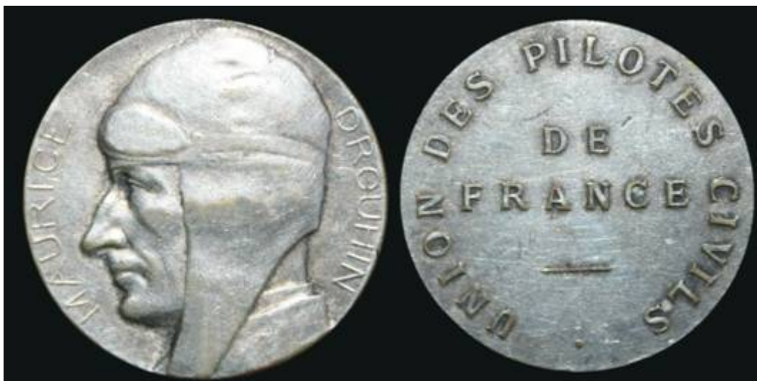
Médaille de l'Union des Pilotes de France - Maurice DROUHIN