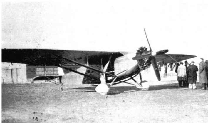
LE FARMAN 390 DE " L'INTRAN " A LA SÉNIA LE 8 DÉCEMBRE

2) Dans le numéro du « Manche à Balai » de fin décembre 1933 :