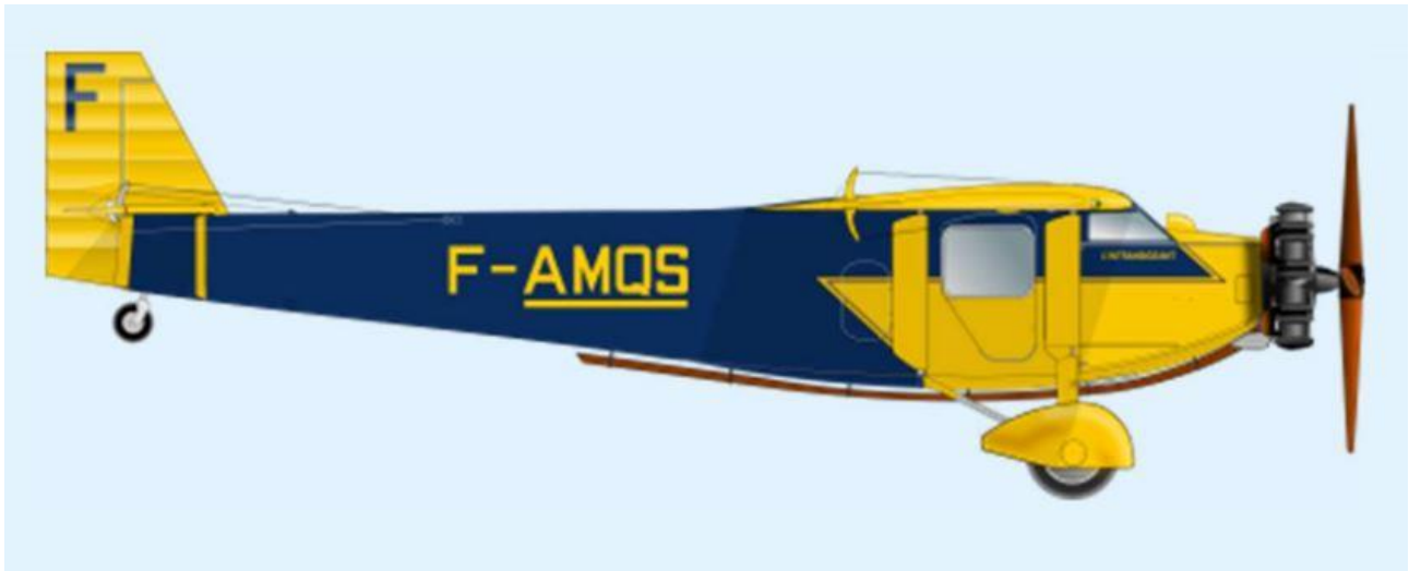
Michel Barrière – Droits réservés

Michel BARRIÈRE, dans son étude très complète du Farman 190 , donne la représentation suivante du n°5 « F-AMQS » :