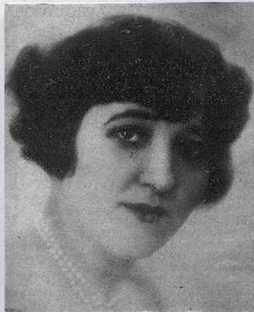
L'AVIATRICE MARYSE HILSZ QUI A BATTU LE RECORD FÉMININ DU MONDE D'ALTITUDE EN S'ÉLEVANT A 10.200 MÈTRES.